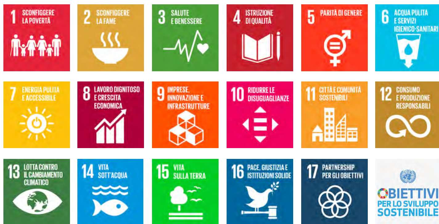
RAPPRESENTAZIONE 2: I 17 SDGs Agenda 2030 sullo sviluppo sostenibile

L'Agenda individua 17 obiettivi di sviluppo sostenibile basati sulle tre dimensioni (ambientale, sociale, economica) e caratterizzate dallo sviluppo di un welfare territoriale generativo, finalizzato all'implementazione delle relazioni di comunità, con le quali è possibile scambiarsi esperienze e buone prassi, ma soprattutto di agire condividendo analisi, valutazioni, progettualità e risorse in una logica di sviluppo includente di matrice multilivello.